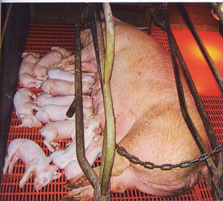
erst das Fressen oder erst die Moral?

les andere ist Spielerei.“ Bisschen kleiner als Haßleben, und Haßleben wird noch moderner. Haßleben, sagt er, das kommt. Das kriegen wir hin.