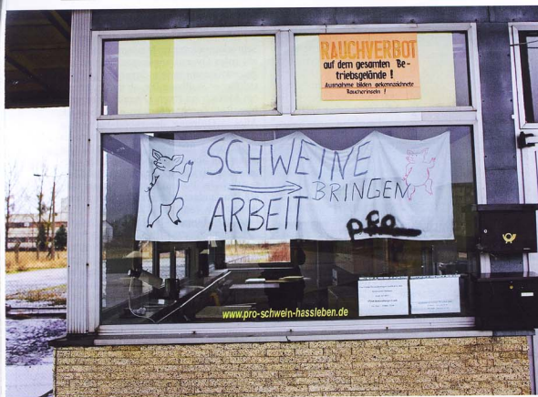
Eingang zur alten Mastanlage in Hasleben: „Es muss doch riechen auf dem Land“

Schwein an Schwein. 30 Tage alt sind sie, seit einer Woche von der Mutter weg, sie schnüffeln auf kahlem Boden, eines kaut auf fremdem Ohr herum. Zur Beschäftigung gibt es in jedem Koben eine feingliedrige Kette, daran können sie schlotten und ziehen.