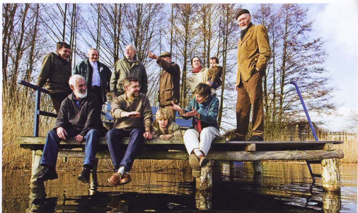
Gruppe „Kontra Industrieschwein“, Muttersau in der Mästerei Sandbeindorf: Die alte Frage –